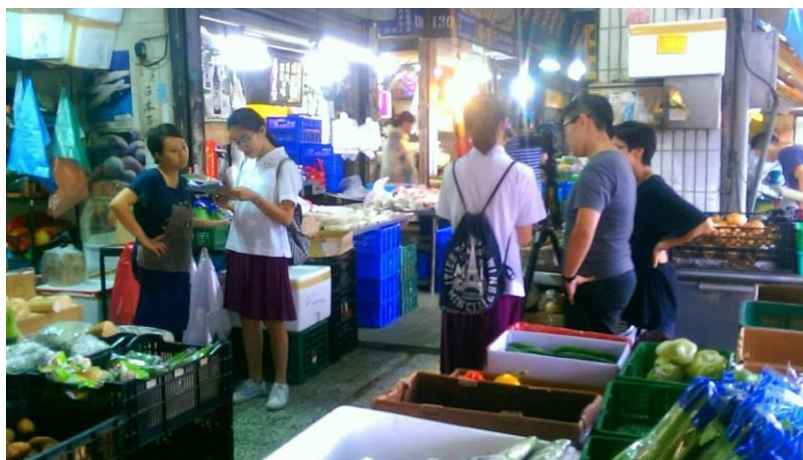
圖一 舊建國市場訪查