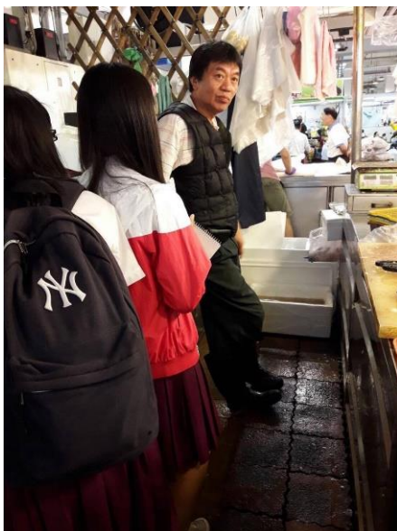
圖四：新建國市場訪查

1、新建國市場開幕後，於民國 105 年 11 月 6 日進行新建國市場實地訪查，主要針對攤商設施及整體滿意度進行訪問。訪問結果統計如下表一。