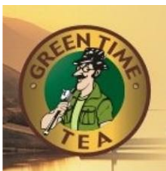
圖一：1992 年金車波爾茶廣告商標

當時青少年的休閒娛樂以電視為主，故常常接觸到電視廣告，這些廣告往往會使用一些誇飾或擬人的手法來設計台詞，給人深刻的印象。此外，因為這些台詞通常都是簡單易懂的句子，容易讓人琅琅上口，久而久之便成為了流行用語。例如：「鼻子尖尖的，鬍子翹翹的，還拿根釣竿」(如圖一)。另外，尚有許多廣告流行用語，整理如表一。