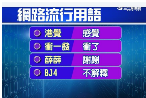
圖三：網路流行用語

以下是其中一篇有關流行語的報導整理出的資料（如圖三、圖四），顯示了青少年使用頻繁的幾句流行語。