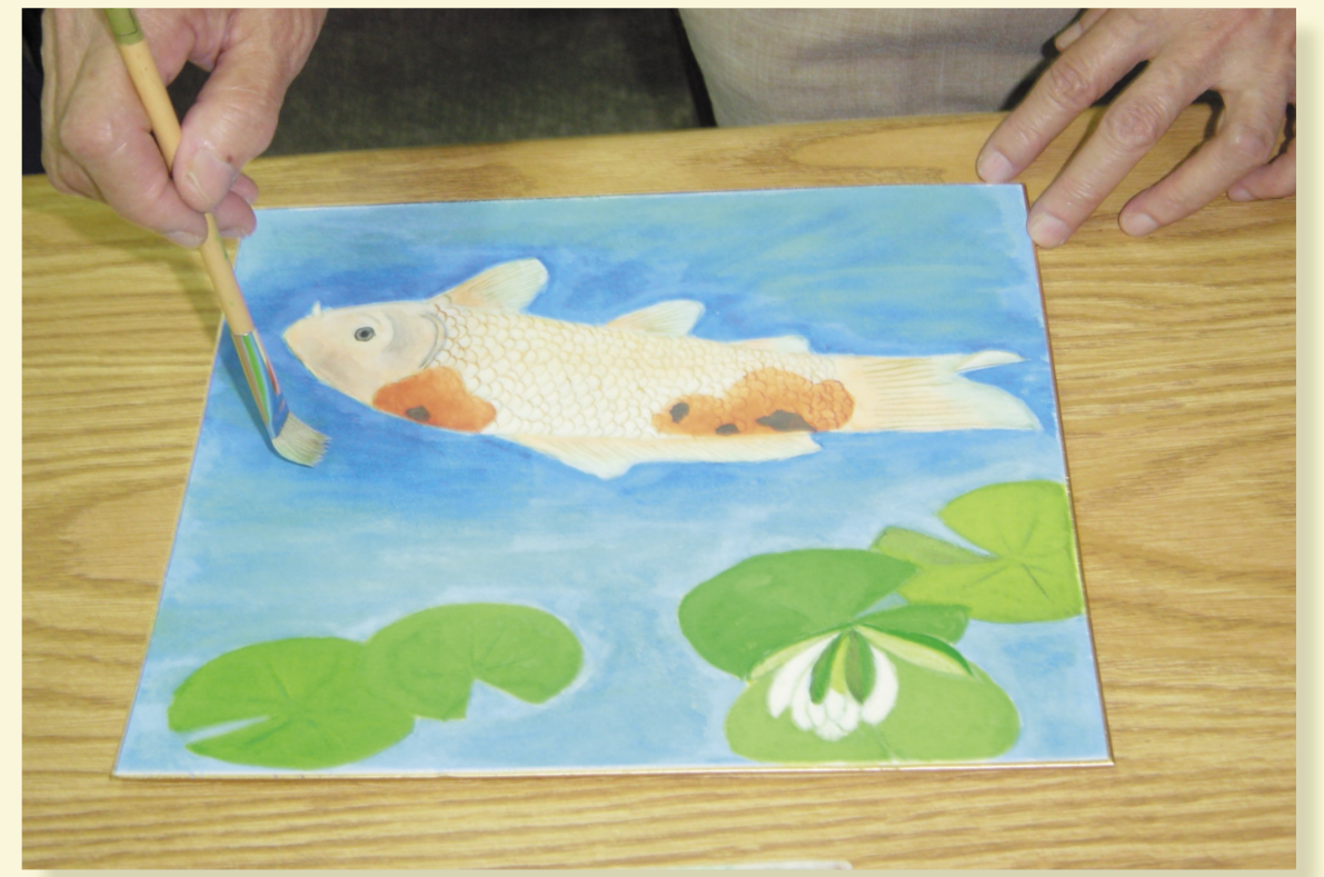
紙本⑥水干畫好再上「礦物」顏料