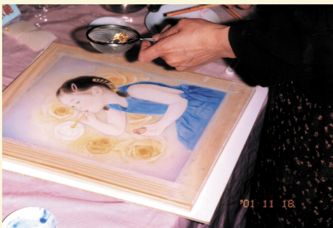
絹本⑦先塗膠水再撒金箔於適當位置後壓牢