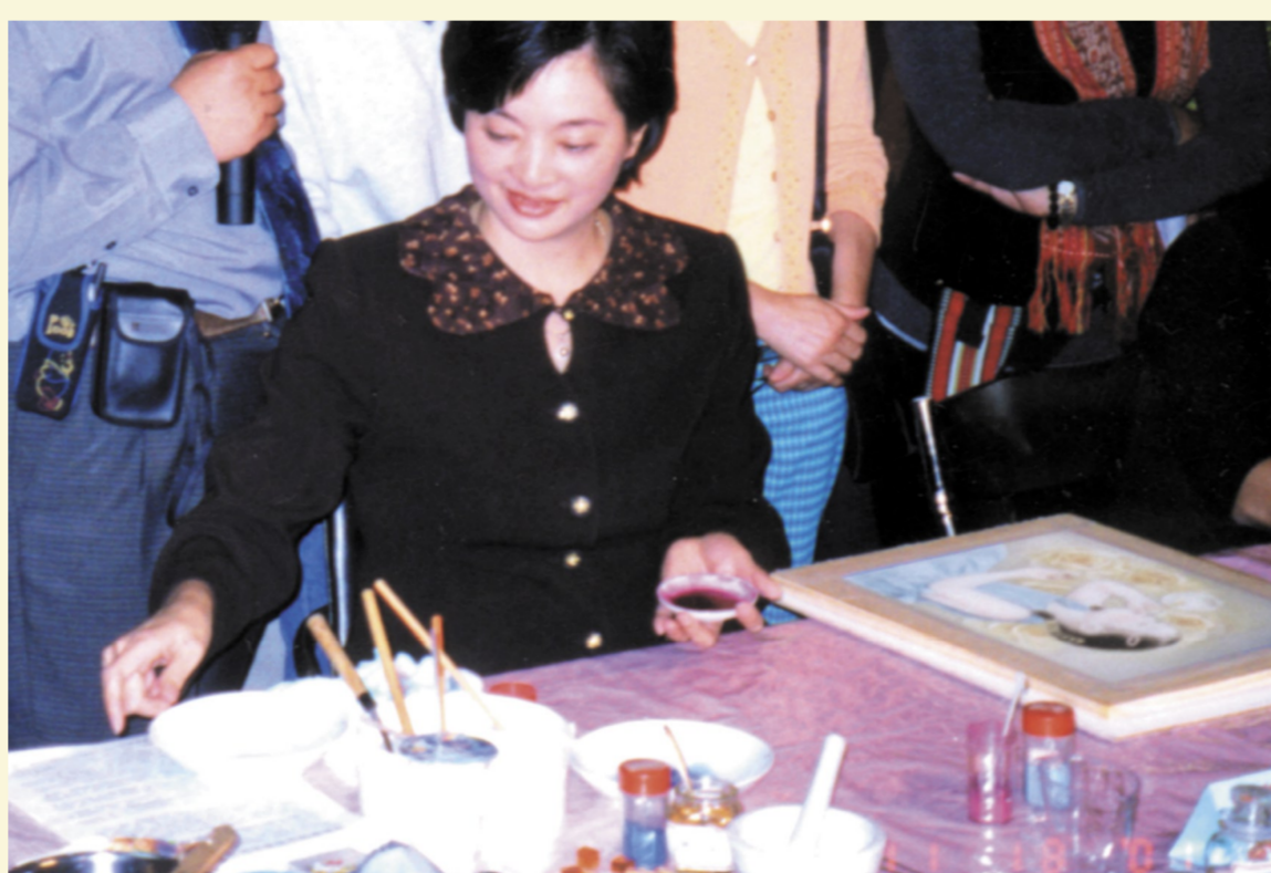
絹本④以鹿膠溶劑調合顏料