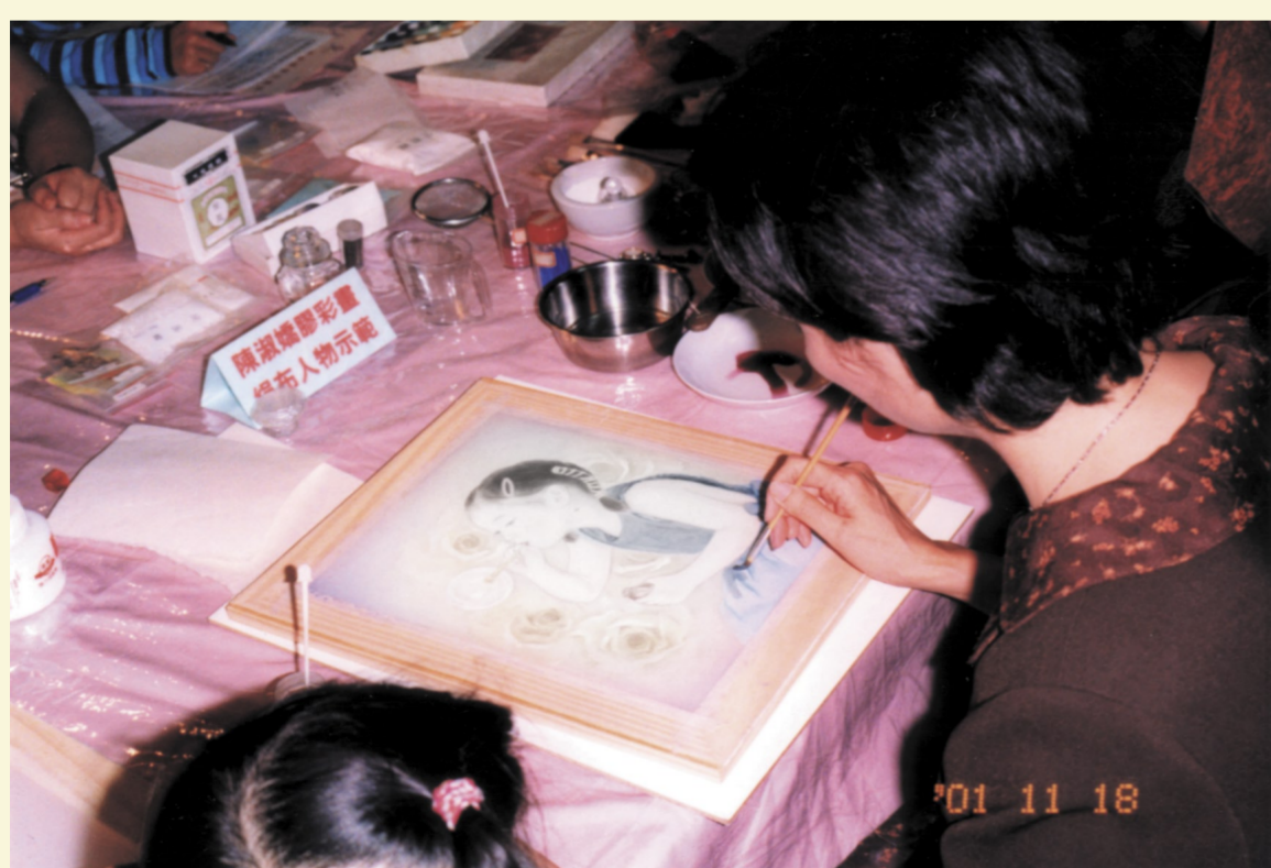
絹本③將畫稿托於繪絹下描繪再上墨色