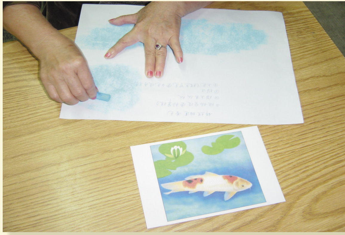
紙本①稿紙背面以彩色粉筆塗抹均勻