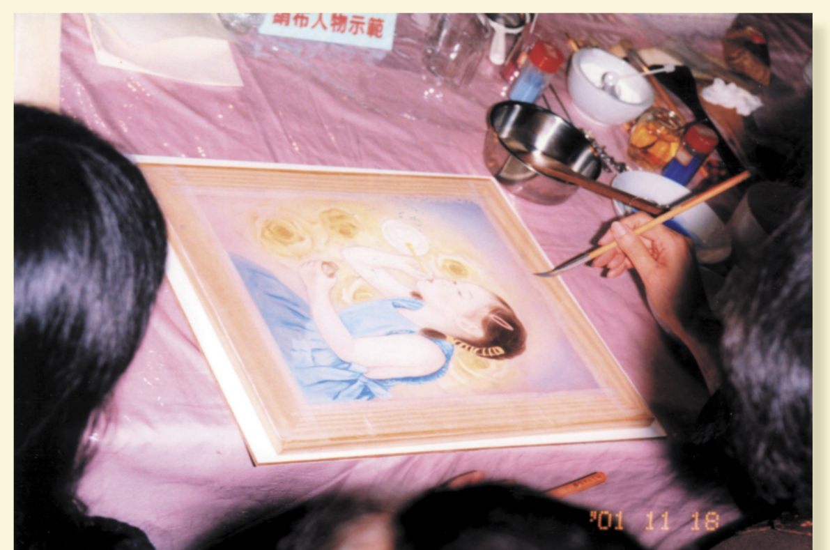
絹本⑤先上土質(水干)顏料打底