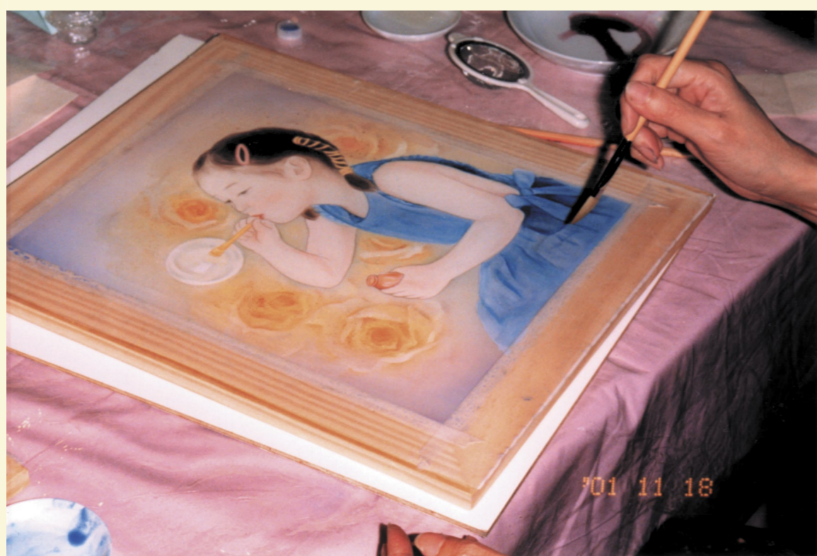
絹本⑥再上礦物質顏料以增加華麗感