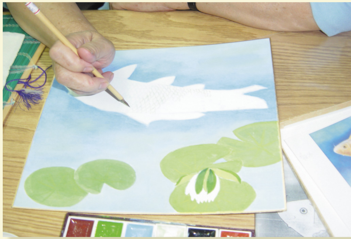
紙本④勾勒「輪廓」並上色