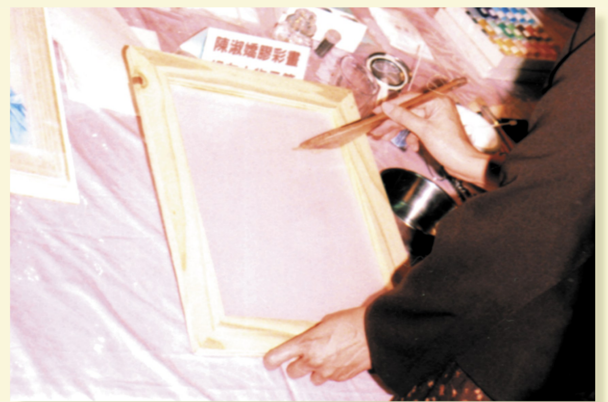
絹本②用膠礬水塗在繪絹以利上色