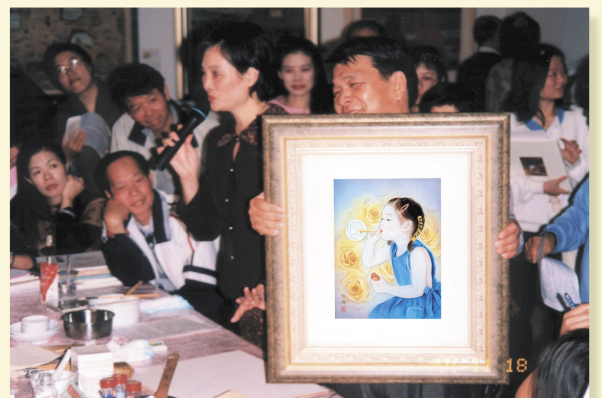
絹本⑧作品完成後裝精美畫框