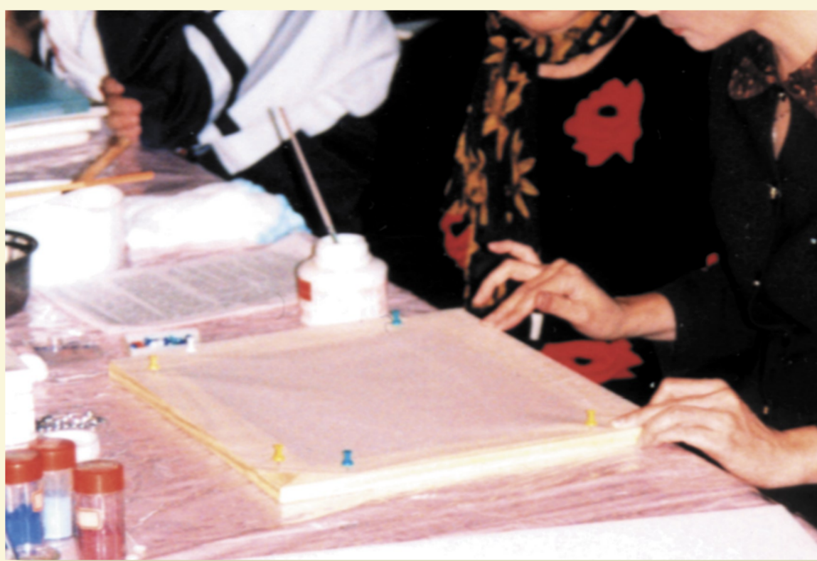
絹本①繪絹以樹脂粘貼於木框四邊