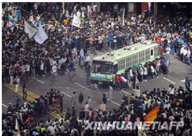
圖一：韓國發生大規模抗議進口美國牛肉的示威游行