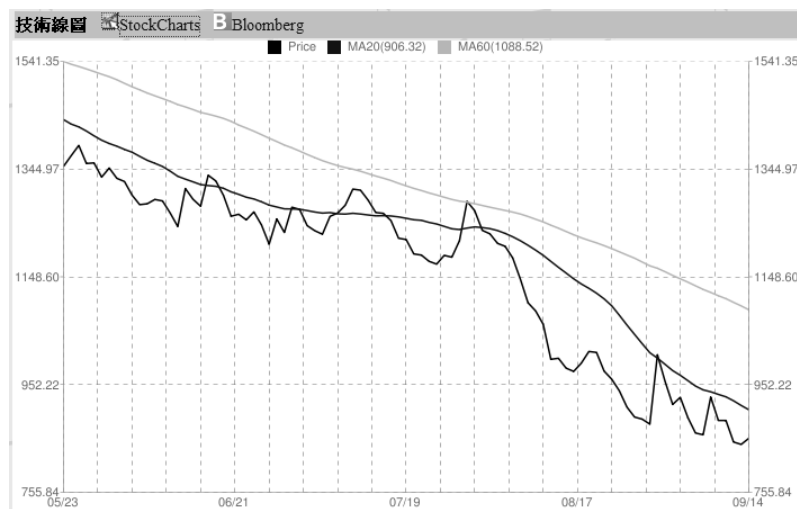
圖一：2011年希臘5~9月股市走勢圖

(圖片資料來源：取自 stock Q.org 網址 http://stockq.org/ ，2011)