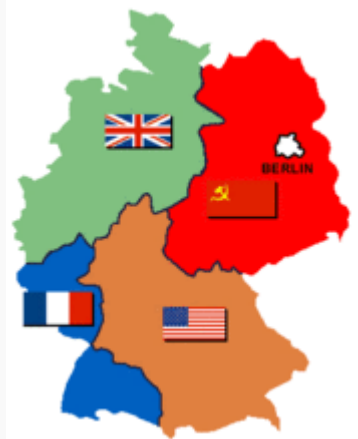
(圖一) 1945 年戰後德國領土分治圖