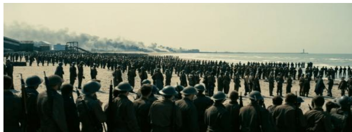
圖三：敦克爾克大行動電影劇照