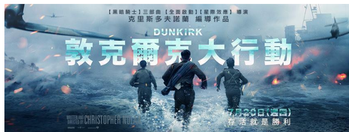
圖一：敦克爾克大行動電影宣傳照

英國導演克里斯多福·諾蘭的作品裡，許多透過電影傳達的意念總是令人無比動容，其一是黑暗時刻的人性良善，像是〈黑暗騎士〉裡，小丑正是利用著人性的弱點擾亂整個城市，一下子便將哥譚市裡的正義力量逼入絕境；其二是亂世之中的人文精神，〈全面啟動：一個人夢神偷的故事〉告訴我們，雖然意外的小插曲頻頻發生，但因為每個人都能夠堅守本分並信賴其他組員的判斷，才使任務得以順利完成。後來，我們從許多公車車身上看到〈敦克爾克大行動〉電影的廣告，斗大的圖片印上：存活就是勝利、當 40 萬士兵無法回家，家迎向了他們……等字句，深深被「存活就是勝利」這句話所透露出的渴望和無情震撼，好奇究竟這四十萬士兵面臨了怎樣的困境？歷史課中提過的「敦克爾克精神」一詞又和這場行動有何關聯？看完電影後，我們知道了這部電影的故事大綱和大致背景，想更了解這場撤退的詳細起因、影響及後續發展，進一步探討電影中描述甚多的人性且將其和所學過的歷史或理論做連結。因此著手寫下關於〈敦克爾克大行動〉電影中險露出的人性以及險惡大環境之下將軍、士兵以及平民百姓內心中的掙扎。