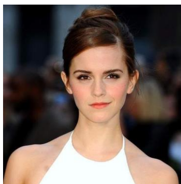
(圖三資料來源：艾瑪·華森推薦書單。BOBOFISHO。2020 年 9 月 19 日，取自 https://images.app.goo.gl/arGSz2hnD1B8mnER6 )

出生於 1990 年出生於法國巴黎，從小夢想能成為演員，並進入了驛馬戲劇藝術學校牛津分校就讀。在英國作家 J·K·羅琳 (J. K. Rowling) 著作《哈利波特：神秘的魔法石》的改編電影中，飾演妙麗一角，從此知名度大幅提升，之後也參與了多部電影的拍攝。艾瑪·華森是著名的女權主義者，她走訪孟加拉和尚比亞，為了在當地推動和促進女性教育。2014 年，她被選為聯合國全球親善大使，從此也開啟一連串的女權運動，於聯合國演講後，為女性運動「他為她」(HeForShe)，拉開了序幕。(圖三) 即為艾瑪·華森。