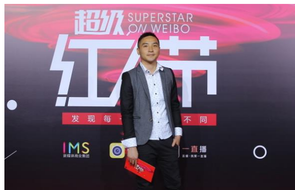
圖二：谷阿莫出席超級紅人節活動

谷阿莫，本名仲惟鼎，是一名台灣YouTuber，以搞笑、幽默、諷刺風格知名於多個影音社群。影片可分為解說電影、改編故事、教你用嘴做菜、今天也要打嘴炮等系列影片；聞名於「X分鐘看完電影系列」，將總時數長達數小時的系列電影、電視劇、網路劇，在 1 至 20 分鐘以內，用幽默的個人風格講解並同時講評劇情。截至 2018 年 3 月，他的YouTube頻道訂閱者已經超越 130 萬名，臉書有超過 240 萬按讚次數，微博則擁有 870 萬以上粉絲數量，同時也身兼「知識糖果數位社群媒體股份有限公司」執行長。