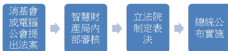
圖三：向政府要求立法保護個人隱私之流程

社會群體中的每一個人需要在尊重個人隱私上達成共識，形成社會力量，透過遊說團體，監督政府立法保護個人隱私，要求企業保護個人隱私不被侵犯。