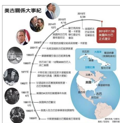
圖七：美古關係年度表

對於兩國趨向正常化的趨勢，美國國內有截然不同的聲音。古巴流亡人士芳塔尼爾表示：「這是一個出賣行為。這一談判只能讓古巴受益。」（芳塔尼爾，2014）而美國前總統小布希的弟弟，前任佛羅里達州州長，現任 2016 年共和黨總統候選人傑布·布希則表示：「我不認為我們應當與一個專制性的政府進行磋商來改變我們的關係。」（傑布·布希，2014）美國前國務卿希拉蕊則曾於自己的回憶錄《抉擇》裡提倡美古應當復交，她說：「我們實施幾十年的孤立政策，只不過讓卡斯楚政權更穩而已。」（希拉蕊，2015）在美洲峰會上，歐巴馬說：「古巴總統現在和我同在一起，就是一個歷史的場合。冷戰年代早已結束，美國不再是對古巴和地區歷史的困徒。」（歐巴馬，2015）「我相信卡斯楚總統會同意兩國將繼續存在分歧，如我們把握這機會追求共同利益，一定可以為兩國提供合作機會。」（歐巴馬，2015）對於兩國這次的合作，各方看法皆不盡相同，而合作本身在不同面向，也必對兩國有不同程度的利益或虧損。兩國對利弊的取捨，以及能否達成共識，則關乎此合作的成功。