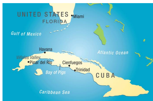
圖二：豬灣所在位置圖

上都是一個很大的失敗，但更確立美國政府想以武力推翻古巴政府的決心，同時也讓古巴更親近蘇聯，最終導致古巴導彈危機。