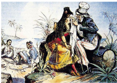
圖一：美國試圖插手古巴事務。