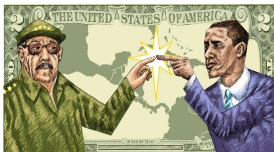
圖五：雖然外界對古巴釋放政治犯感到高興，卻也不禁懷疑兩方的和解可能造成更多人權的迫害。

2014 年 12 月 17 日，美國總統歐巴馬正式宣布，希望恢復和古巴的外交關係，就在當天，古巴領導人勞爾·卡斯楚也釋放被囚禁五年的美國承包商，艾倫·格羅斯。艾倫·格羅斯在 2009 年到古巴時，帶給當地猶太人衛星電話和網路設備，隨後就被古巴政府以「破壞古巴獨立和領土完整」的理由逮捕。2011 年，艾倫·格羅斯被古巴政府判監禁 15 年，由於他的健康逐漸在惡化，假如艾倫·格羅斯最後真的死在古巴監獄，美國和古巴之間必定會存在著一道難以彌補的鴻溝，這也促成了美古關係的解凍。